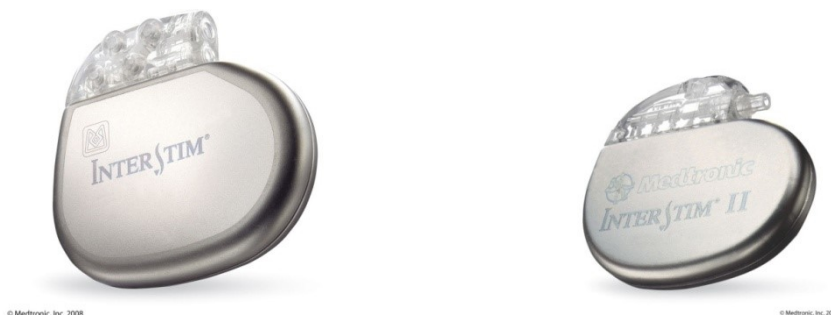
2. Twee verschillende soorten neuromodulatoren, links de InterStim en rechts de InterStim II.

Let op!: Is bij u een neuromodulator geplaatst? Dan gelden wél nog steeds de 'beweegregels' zoals niet bukken, tillen enzovoorts gedurende ongeveer twee extra weken (zoals tijdens de testperiode).