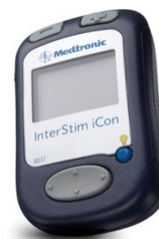
1. De afstandsbediening.